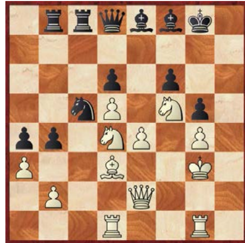
(red.: vreemd gezicht zo al die stukken op de 8 e rij)

Fritz 14: 38. ... bxa3, 39. bxa3 Ld7, 40. Th1 De8, 41. Pe6 Pxe6, 42. Dh2 Pg7, 43. Ph6+ Kh8, 44. Pf7+ Kg8, 45. Ph6+ Kh8, 46. Pf7+ Kg8, 47. Ph6+ Kh8, 48. Pf7+ Kg8, 49. Ph6+ Kh8, 50. Pf7+ Kg8, 51. Ph6+ Kh8, 52. Pf7+ Kg8, 53. Ph6+ Kh8, 54. Pf7.