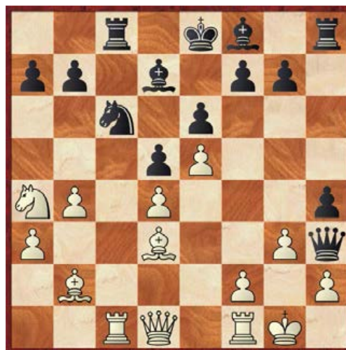
Iroy Ockeloen - Han Smit na 18. ... Dh3.

Han dacht heel erg goed te staan en ging de witte koning even h-lijnen. Dat ging niet goed want zijn dame raakte opgesloten (0-1). Zie diagram.