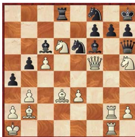
[●●●●●] wit geeft mat in 6