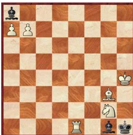
[●●●●] wit geeft mat in 3