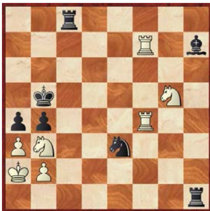
[●] zwart geeft mat in 2