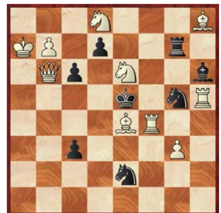
[●●●●●●] wit geeft mat in 2