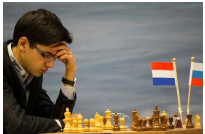
Anish Giri - Sergey Karjakin (½-½)