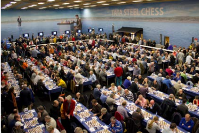
Tata Steel Chess 2014 in De Mondriaan in Wijk aan Zee.