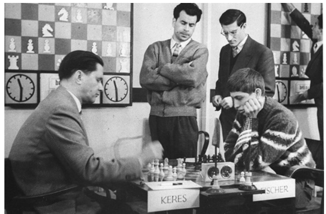
Paul Keres (l) tegen Bobby Fischer in 1959.