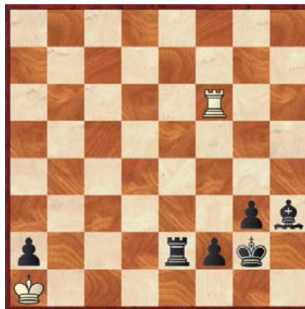
[●●] wit speelt en forceert remise