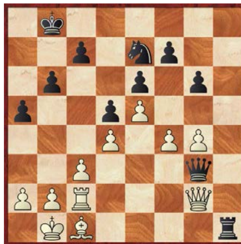
Daan Smit - Steef Bergakker na 30. Dg2.

Daan speelde tegen de hoogst gerate tegenstander. Pas na de 26 e zet van wit kwam hij steeds meer in moeilijkheden. Op het laatst stond hij verloren, maar dat het zo snel zou gaan had Daan ook niet gedacht. Hij verloor na een verrassende combinatie (zie diagram). Een specialiteit waarmee Daan meestal zelf wint, maar dit keer helaas niet (0-1).