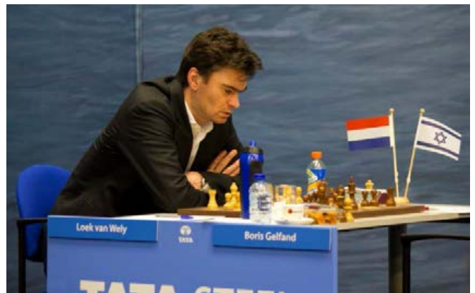
Loek van Wely - Boris Gelfand (0-1)