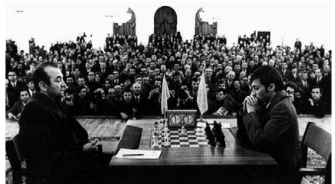
Korchnoi opent met 1. c2-c4 tegen Karpov in 1974.

Pf6xd5 8. c4xd5 ..., maar ook het vreemd ogende Pf3-h4 geeft wit voldoende mogelijkheden.