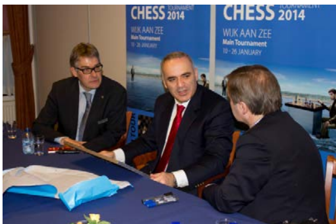
Kasparov krijgt een cadeau van de organisatie overhandigd.