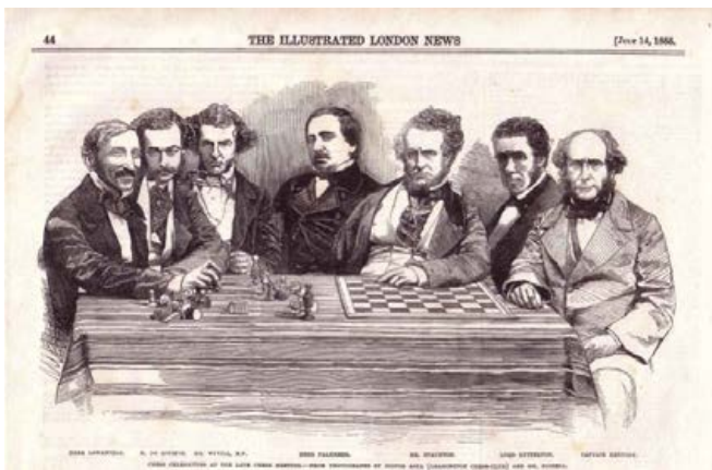
Howard Staunton in het midden met zijn arm op het bord (5 e van rechts).

De Engelse Opening ontleent zijn naam aan de Brit Howard Staunton, die deze opening voor het eerst speelde in 1843 tijdens het 1 e international schaaktoernooi. De opening sprak toen totaal niet tot de verbeelding van zijn opponenten en werd pas populair in de twintigste eeuw. Op dit moment is het één van de meest solide openingen om een klassieke of moderne stelling te bereiken. Botvinnik, Petrosian, Kasparov, Karpov en Carlsen speelde het tijdens het WK en Fischer zorgde voor roering toen hij zijn e4 er voor inruilde tegen Polugaevsky en Panno (1970) en Spassky (1972).