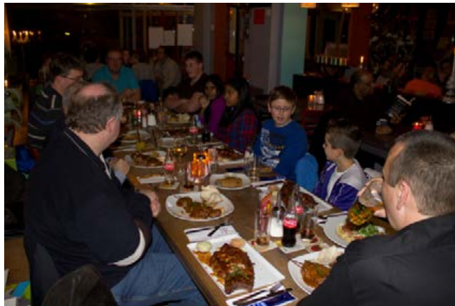
Schaken en dineren in Hotel Sonnevand.

Kortom het was een zeer leuke en geslaagde dag met SG Overschie bij Tata Steel Chess 2014. Een dergelijk uitstapje met junioren en senioren samen is zeker voor herhaling vatbaar. Waar gaan we de volgende keer heen en jij gaat dan toch zeker ook mee?